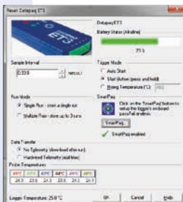
EasyTrack Insight 专业版重置对话