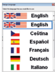
运行中可随时切换软件语言