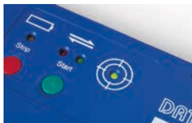
ET3 记录器 SmartPac* - 记录器指示运行“成败”