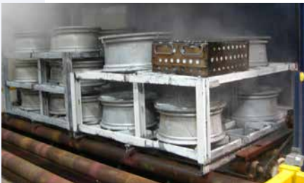
DATAPAQシステム搭載の製品バスケット

注意：この熱保護システムは水焼き入れといくつかのポリマーにしか使用できず、油焼き入れには使用してはいけません。