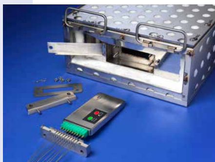
DATAPAQ TB4160 耐熱ボックス