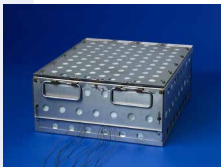
DATAPAQ LHQ 耐熱 ボックス