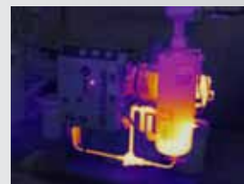
75 % Überblendung